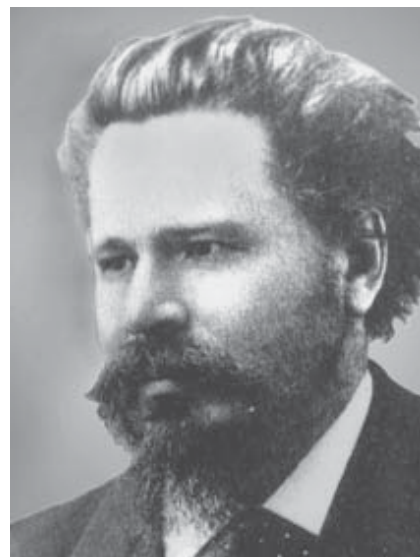
В. В. ПІДВИСОЦЬКИЙ