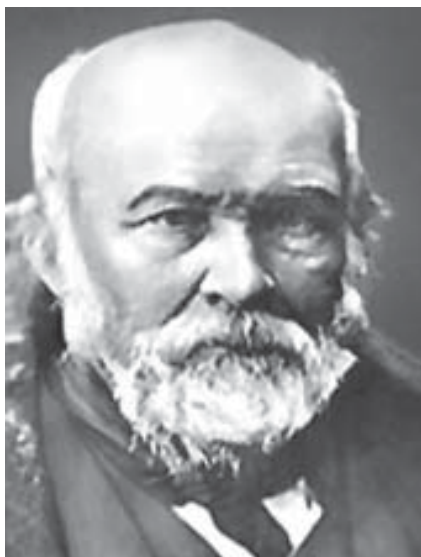
М. І. ПИРОГОВ