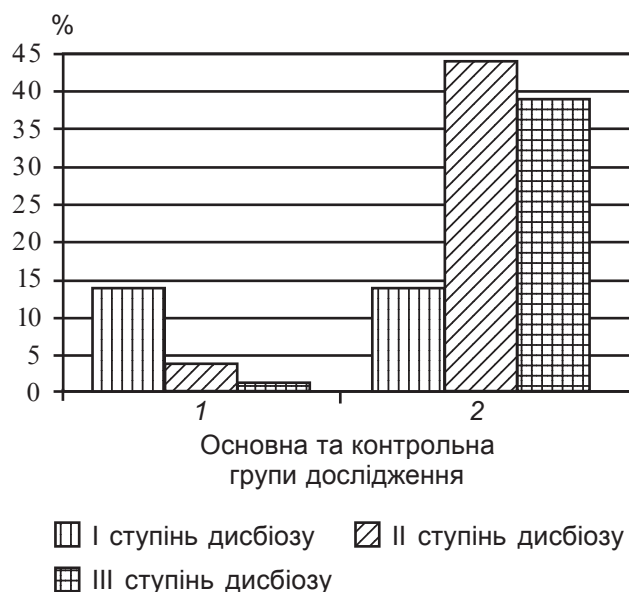
Рис. 2. Стан мікробіоценозу товстої кишки у дітей грудного віку, хворих на гострий обструктивний бронхіт, після лікування