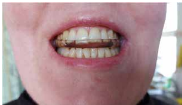
Рис. 2. Капа Michigan-splint пацієнтки Ж., 41 р.

пацієнтка продовжувала лікування у ортопеда-стоматолога, приймаючи симптоматичну терапію – антиконвульсанти (до 4-х разів на день), антидепресанти та нестероїдні протизапальні препарати, стан покращувався на деякий час.