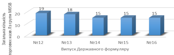
Рис. 3. Асортименту лікарських засобів групи М05В у 12–16-му випусках ДФЛЗ

Наступним етапом дослідили Реєстр ОВЦ та Національний перелік, якими мають користуватися ЗОЗ під час закупівлі ЛЗ за кошти державного та місцевих бюджетів. Так, ЗОЗ державної та комунальної форм власності, що частково або повністю фінансуються з державного та місцевих бюджетів, здійснюють закупівлі ЛЗ, що в установленому законом порядку зареєстровані в Україні та включені до Національного переліку [16]. За умови задоволення повного обсягу потреби у ЛЗ, включених до Національного переліку, ЗОЗ можуть здійснювати закупівлі зареєстрованих в Україні ЛЗ, які не включені до Національного переліку, якщо їхні діючі речовини (або їхні комбінації) включені до стандартів медичної допомоги або клінічних протоколів, затверджених Міністерством охорони здоров'я [17].