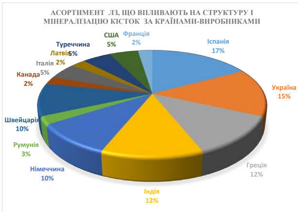
Рис. 1. Структура асортименту лікарських засобів, що впливають на структуру і мінералізацію кісток за країнами-виробниками

Група M05B X «Інші засоби, що впливають на структуру і мінералізацію кісток» представлена 5 ТН ЛЗ, з яких лише один українського виробництва, решта – іноземного. Наступний етап роботи полягав у дослідженні асортименту ЛЗ групи M05B за країнами-виробниками (рис. 1).