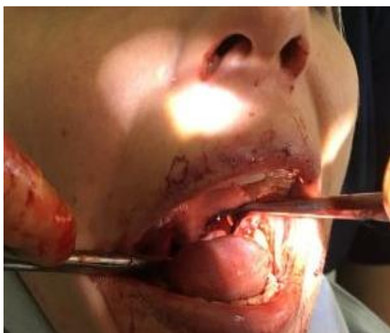
Рис. 11. Видалення шилоподібного відростка під місцевою анестезією

Тонзилектомія виконується класичним способом. У мигдаликовій ніші пальцем знаходимо верхівку шилоподібного відростка, яка візуалізується тупо, відсікається шило-під'язична зв'язка від верхівки, використовуючи абортну кюретку. Гострі краї дефекти загладжуємо, використовуючи кістковий рашпіль (рис. 11).