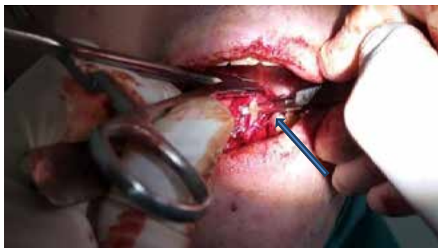
Рис. 12. Осифікована шило-під'язикова зв'язка

На окрему увагу заслуговує висічення осифікованої шило-під'язичної зв'язки (рис. 12).