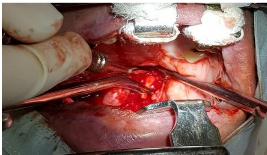
Рис. 9. Етапи операції: резекція шилоподібного відростка, видалення шилоподібного відростка