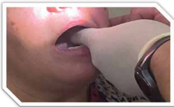
Рис. 2. Пальцеве дослідження ротоглотки з метою виявлення верхівки подовженого шиловидного відростка з використанням функціональних проб (максимальне закидання голови назад)

для найбільш ефективної консервативної терапії шилопід'язикового синдрому, так і для пошуку подовженого відростка шиловидного в рані під час його резекції (рис. 3).