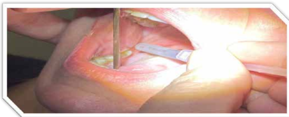
Рис. 3. Виконання ін'єкції в область верхівки подовженого шиловидного відростка

2. Передлежання шиловидного відростка до СНП (сонна артерія або яремна вена) ступінь їх деформації відростком у спокої та під час виконання функціональних проб (під час руху).