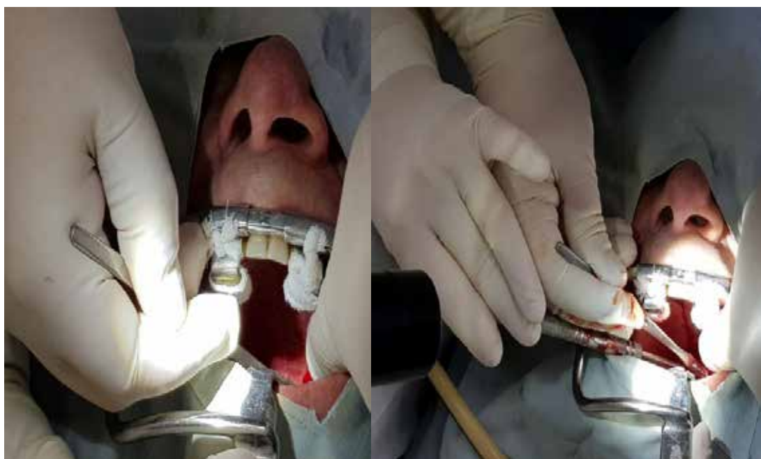
Рис. 5, 6. Етапи операції – резекція шилоподібного відростка, розріз м'якого піднебіння