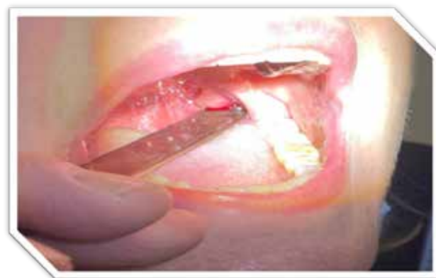
Рис. 1. Огляд хворого зі скаргами, характерними для шилопід'язичного синдрому, використовуючи шпатель

Виявлення верхівки подовженого шиловидного відростка має велике практичне значення як для виконання ін'єкцій лікарських препаратів