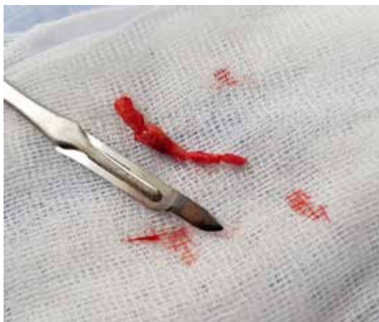
Рис. 10. Видалений фрагмент шилоподібного відростка

Хід операції резекції шиловидного відростка через передню піднебінну дужку без тонзилектомії під загальною анестезією