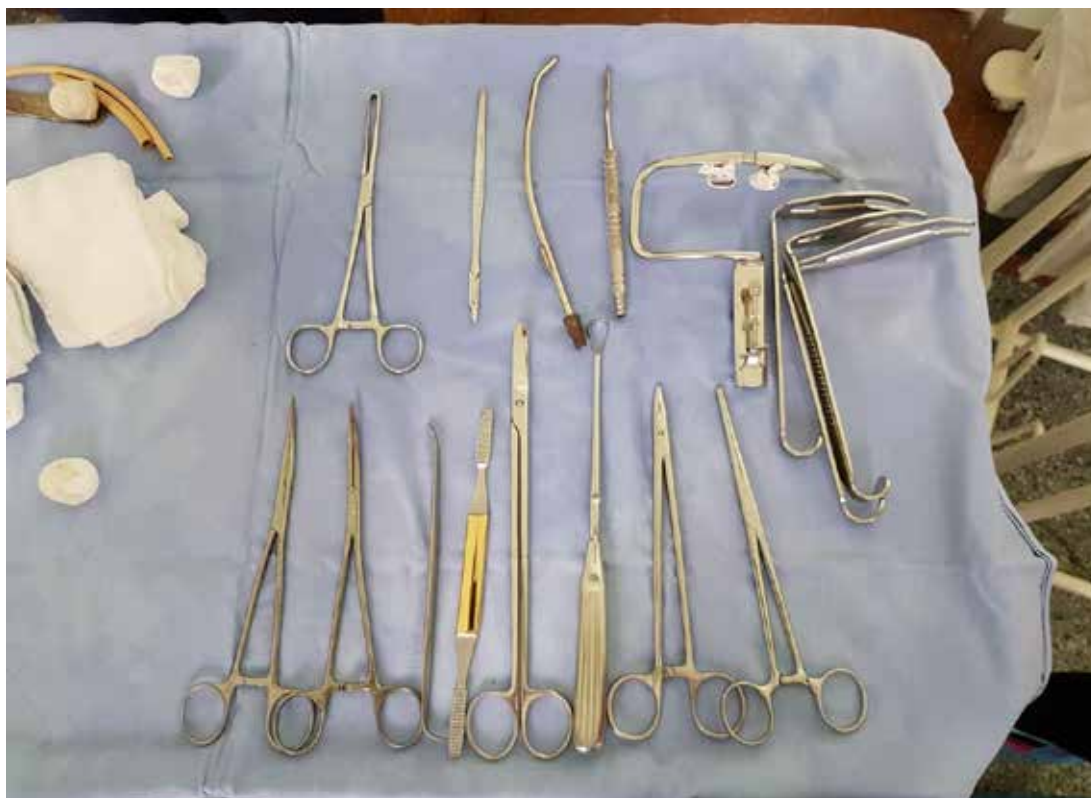
Рис. 4. Інструменти, необхідні для даної операції

Нижче представлено різні методики резекції шиловидного відростка під наркозом та місцевою анестезією (рис. 4–10).