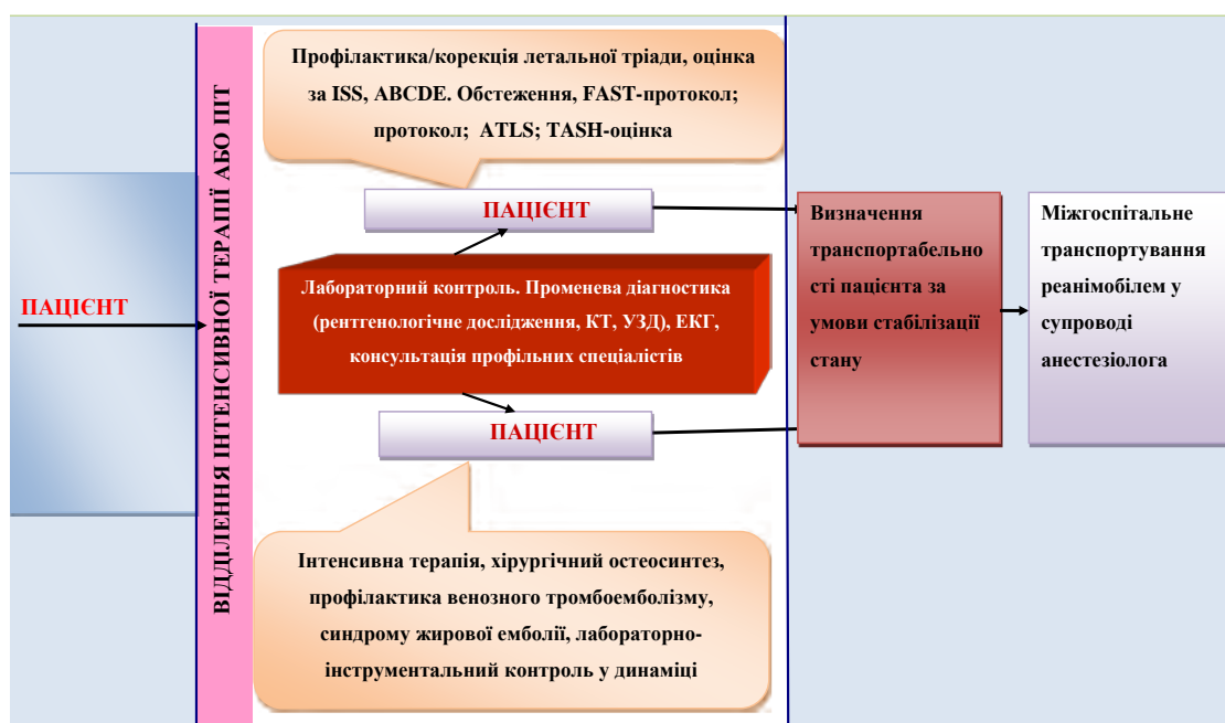
Схема 2. Запропонований протокол медичної допомоги під час міжгоспітального транспортування пацієнта зі скелетною політравмою

травмою, яким медична допомога надавалася згідно із загальноприйнятими рекомендаціями; основна група (n=120) – пацієнти зі скелетною політравмою, яким надання медичної допомоги проводилося згідно із запропонованим клінічним маршрутом пацієнтів, котрий можна застосовувати на другому і третьому рівнях надання медичної допомоги, і запропонованим протоколом медичної допомоги під час міжгоспітального транспортування пацієнта зі скелетною політравмою (схеми 1, 2).