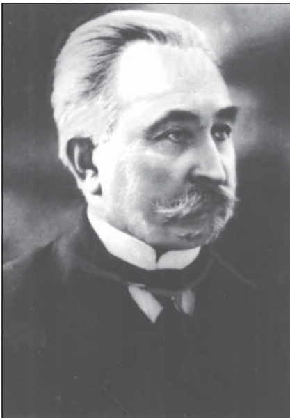
Професор В. П. Якубович

грудних дітей, розробляли питання діагностики дитячих інфекцій. Підручник В. П. Якубовича з діагностики дитячих хвороб і способів дослідження дітей (1890) тривалий час був настільною книгою педіатрів і студентів. Професор В. П. Якубович залишився в пам'яті учнів як чудовий лектор і організатор кафедри та клініки дитячих хвороб.