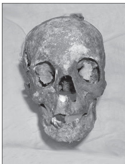
Рис. 4. Черепы после реставрации, использованные для идентификационного исследования