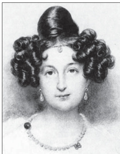
Рис. 3. Фрагменты портретов князя М. С. Воронцова и княгини Е. К. Воронцовой, взятые для идентификационного исследования